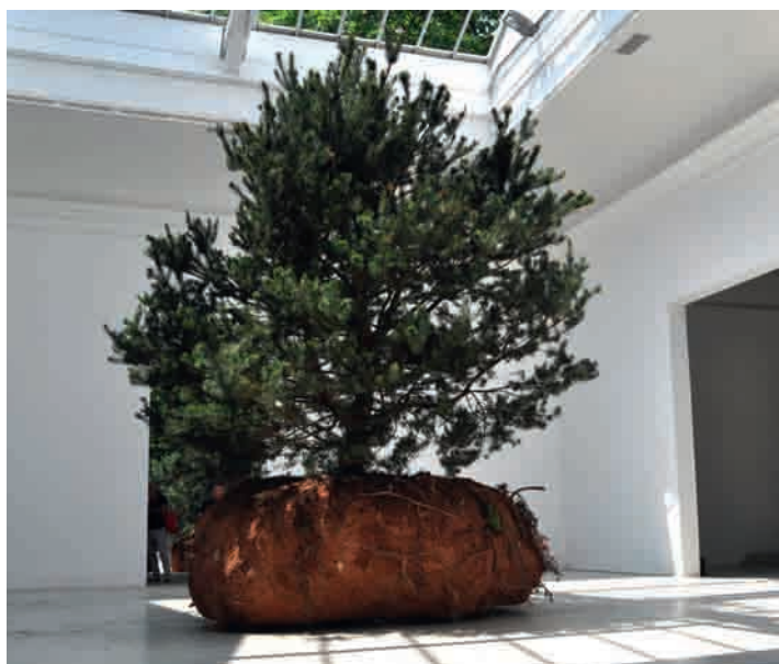
Biennale van Venetië, het Franse paviljoen op de Giardini met de nieuwe boom Transhumus van Céleste Boursier-Mougenot, 2015. 19 juni 2015