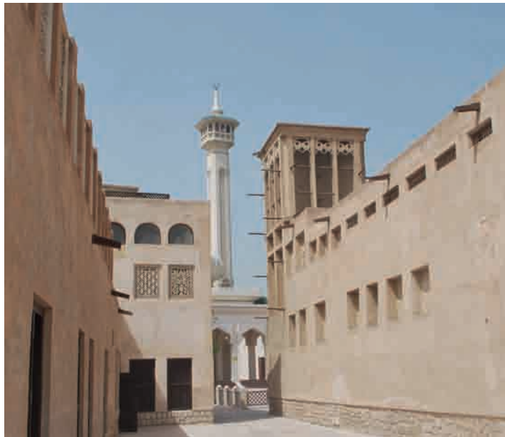
Windtorens Dubai met natuurlijke ventilatie, waarbij natte lappen in de zomer voor koele lucht zorgen. Foto Han de Kluijver, 14 maart 2009

Ook de Biennale van Venetië , met de titel All the world's futures , maakte zich dit jaar sterk om een discussie over het klimaat aan de hand van concrete voorstellen te voeren. In het Franse paviljoen transformeerde de kunstenaar Céleste Boursier-Mougenot (1961) drie dennen uit de Giardini tot een nieuw soort boom: de transhumus, een boom