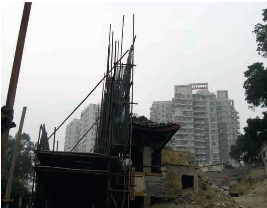
Stad in af/opbouw, Xiamen, een van de snel groeiende steden in China. Foto Danielle Lemaire, 3 maart 2010

die kan bewegen door de elektriciteit die hij opwekt met zijn eigen metabolisme. Variaties in de sapstroom of de opname van licht maken dat de bomen voortbewegen.